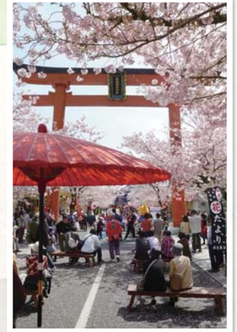
祐徳門前春まつり

五穀豊穰と諸業繁栄を祈願するお祭。万物皆緑になる頃、稲荷大神は山から田へ降り、農事を見守ってください。