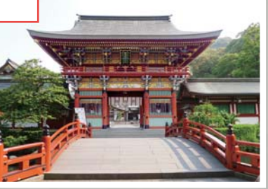
楼門は、日光東照宮の陽明門を模したもので、日光東照宮の修復職人達の手により完成しました。