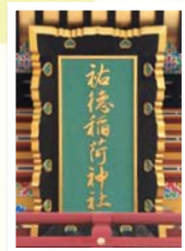
楼門に掲げられている社号額は、能書家で知られる秩父宮妃の直筆です。